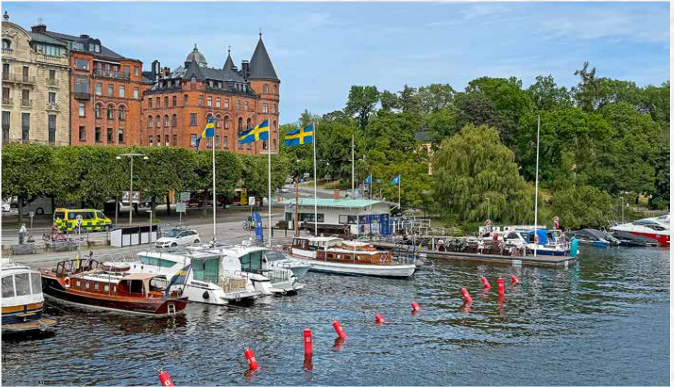
Kungliga Motorbåt Klubbens Båtförbund.