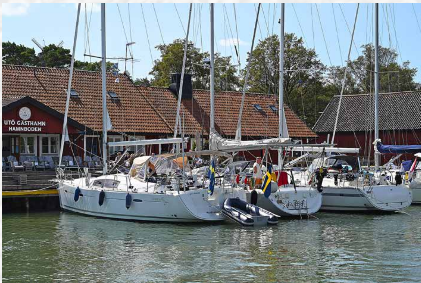
Sommar i skärgården.

Oaxens Båt- och Bryggförening Oxelösunds Motorbåtsklubb Oxelösunds Segelsällskap Pershagens Båtklubb Skepparklubben i Södertälje Sparreholms Båtklubb Stora Vika Båtklubb Södertälje Båtklubb Södertälje Båtsällskap Taxinge Båtklubb Trosa Båtklubb Tureholmsvikens Båtsällskap Utterviks Båtklubb Viksbergs Båtklubb Viksbergs Båtklubb nr 3 Åshorns Båtklubb Östertälje Båtklubb