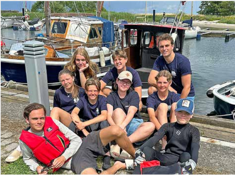
Deltagare i Kiviks Båtklubb's seglarskola sommaren 2025.

Ängsviks Båtsällskap Äppelvikens Båtklubb Örnbergs Båtklubb Örsundsbro Båtklubb Ösmo Båtklubb Österhaninge Båtklubb