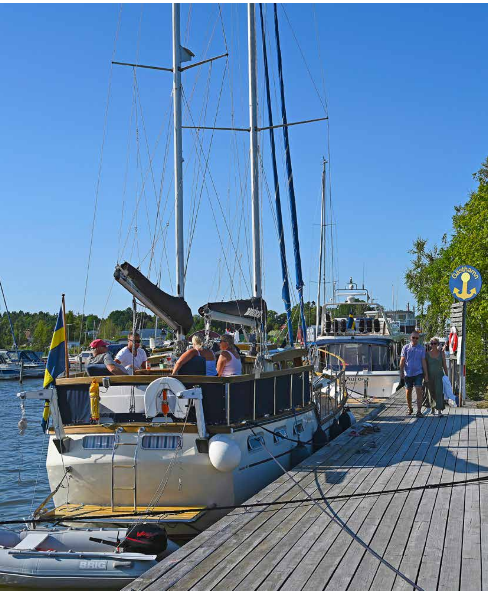
Trosa gästhamn sommaren 2021.