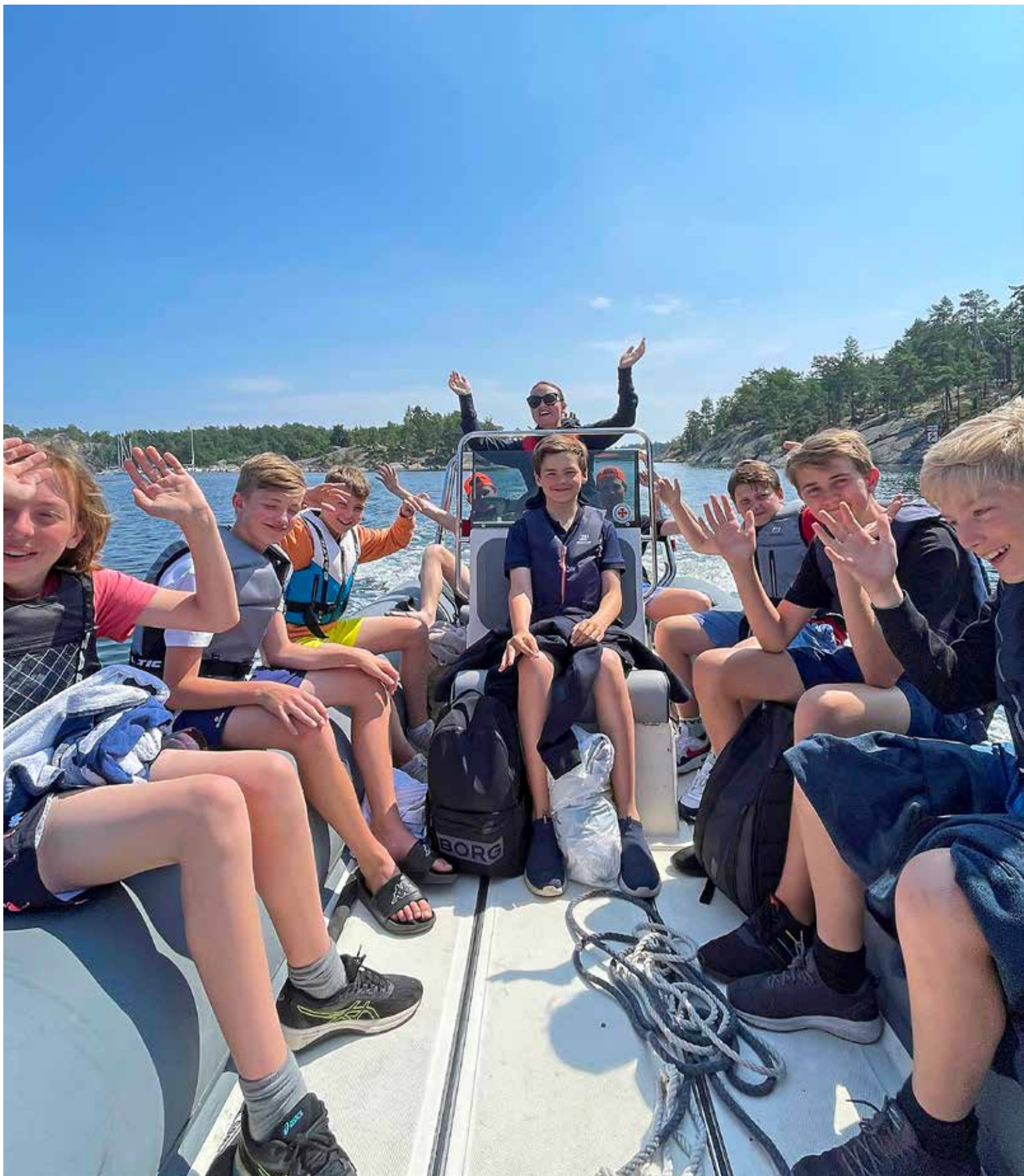
Kungliga Motorbåt Klubbens ungdomsläger innebär en vecka med mycket båtkörning. Nybörjarlägret är även en introduktion till båtlivet, skärgården och förarintyget.