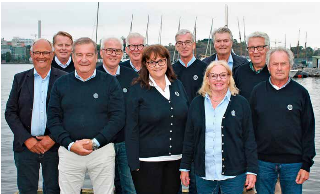
Svenska Båtunionens styrelse.