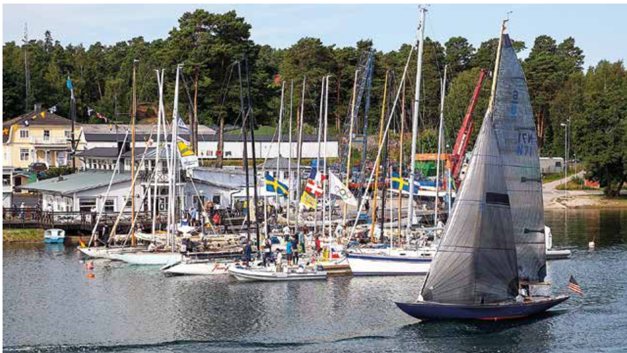
Nynäshamns Segelsällskap vann utmärkelsen Årets Båtklubb 2020.