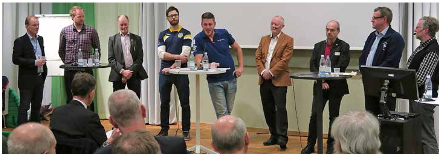
Paneldebatt på Båttinget 2015.

Vid den senaste Båtriksdagen motionerades om att Båtliv ska utvecklas och i högre grad bli ett livsstilsmagasin med fler reportage kring båtlivet, utflyktsmål och upplevelser. Tidningen ska gärna växa i antal sidor medan de båtpolitiska inslagen tonas ner och förflyttas till SBU:s hemsida. Tidningen ska ges en mer offensiv touch för att säkerställa och utveckla läsvärdet, vilket kräver finansiella resurser med ökad budget och eventuella avgiftshöjningar som följd.