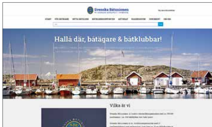
SBU:s nya sajt båtunionen.se.

Under hösten 2015 bytte SBU webbadress och lanserade den nya hemsidan på en ny webbadress. Den nya sajten har en uppdaterad teknisk lösning och ger fler möjligheter att publicera text, ljud och bild media och har ett mycket mer lättarbetat administrationsverktyg.