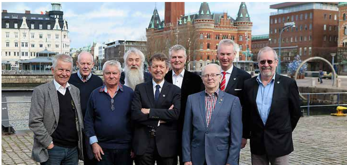
Svenska Båtunionens styrelse 2015 samlad i Helsingborg.

I de 886 anslutna båtklubbarna fanns 170 746 medlemmar 2015.