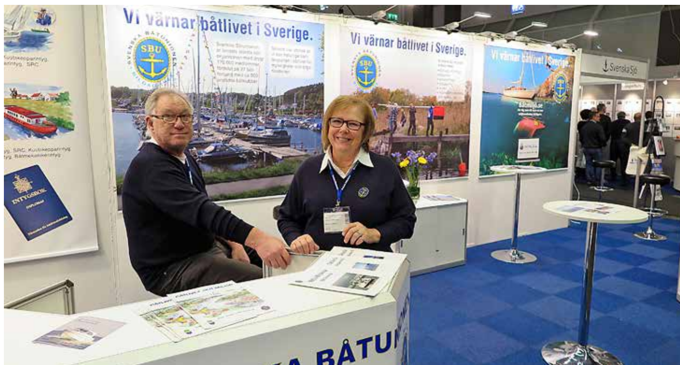
Svenska Båtunionens monter på Båtmässan i Göteborg 2015. Bemannad av medlemmar i Västkustens Båtförbund.