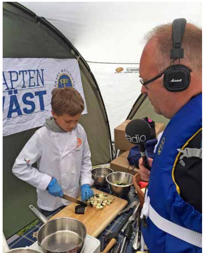
Svenska Båtunionen och P4 Stockholm sände tillsammans Kapten Väst sommaren 2015.