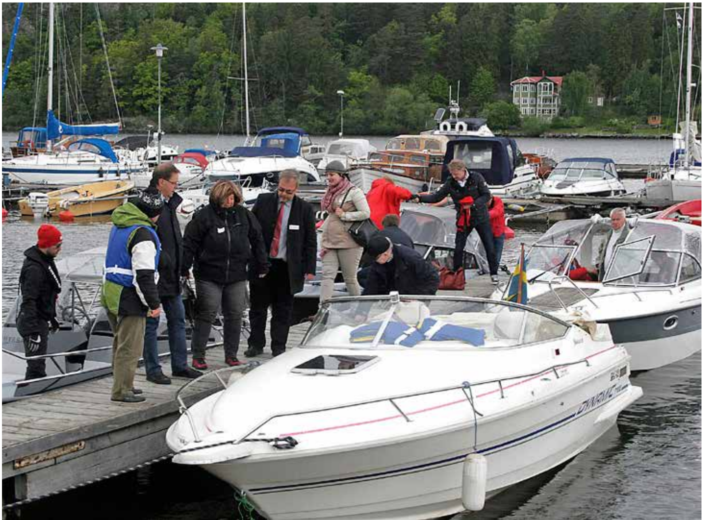
Den årliga utflykten med Riksdagens fritidsbåtsnätverk gick 2015 till Sättra BS.