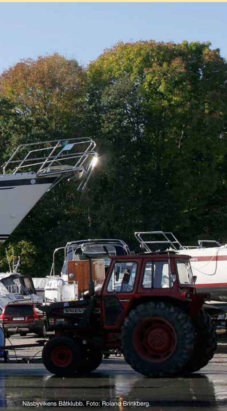
Näsbyvikens Båtklubb.

Hägerstens Båtklubb Hässelby Sjöällskap Hässelby Strands Båtklubb Hästhölmens Båtsällskap Ingarö Lugnet Båtklubb Ingarö Segelsällskap Jakobsbergs Båtsällskap Johannesdals Båtklubb Johannesfreds Båtklubb Kallhälls Båtklubb Kanada Båtsällskap Karlshills Båtklubb Karlskärs Båtklubb Karlsuddsvikens Båtklubb Kasholmens Samfällighetsförening Kilsvikens Båtklubb Klintens Båtklubb Kolströms Båtklubb Kopparmora Båtklubb Kristinebergs Båtklubb