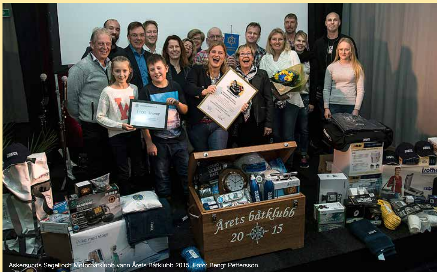
Åskersunds Segel och Motorbåtklubb vann Årets Båtklubb 2015.