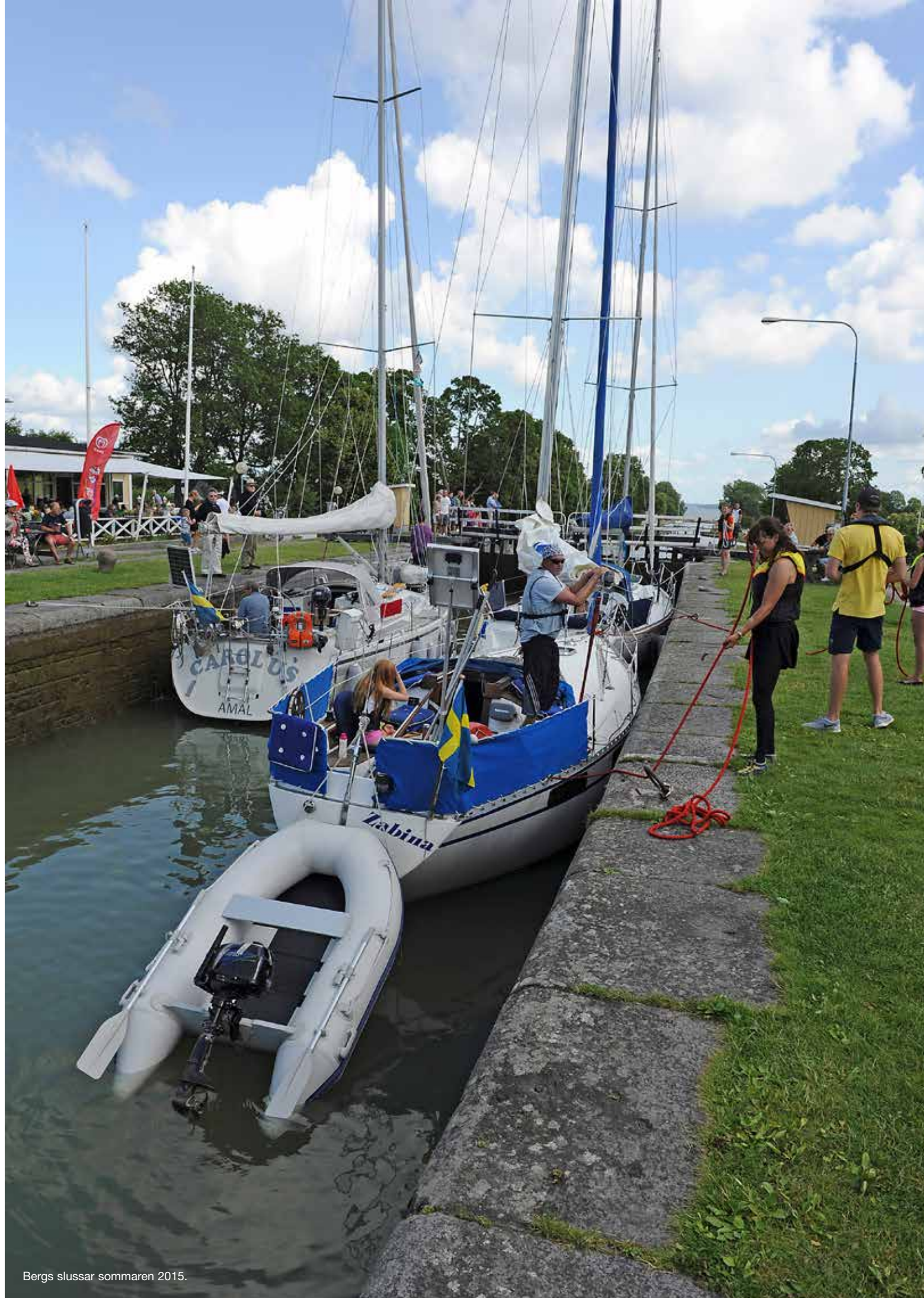
Bergs slussar sommaren 2015.