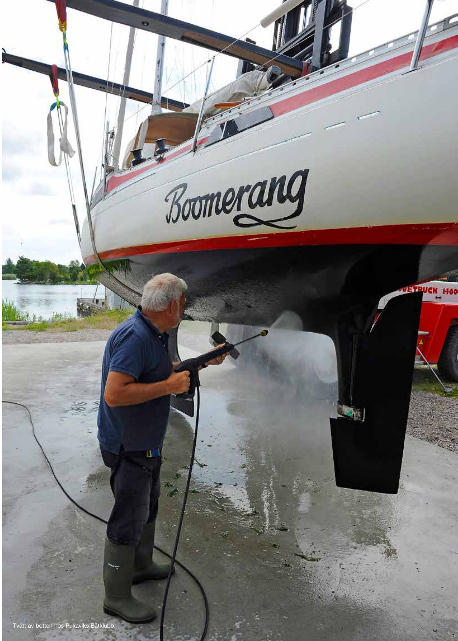
Tvätt av botten hos Pukaviks Båtklubb.