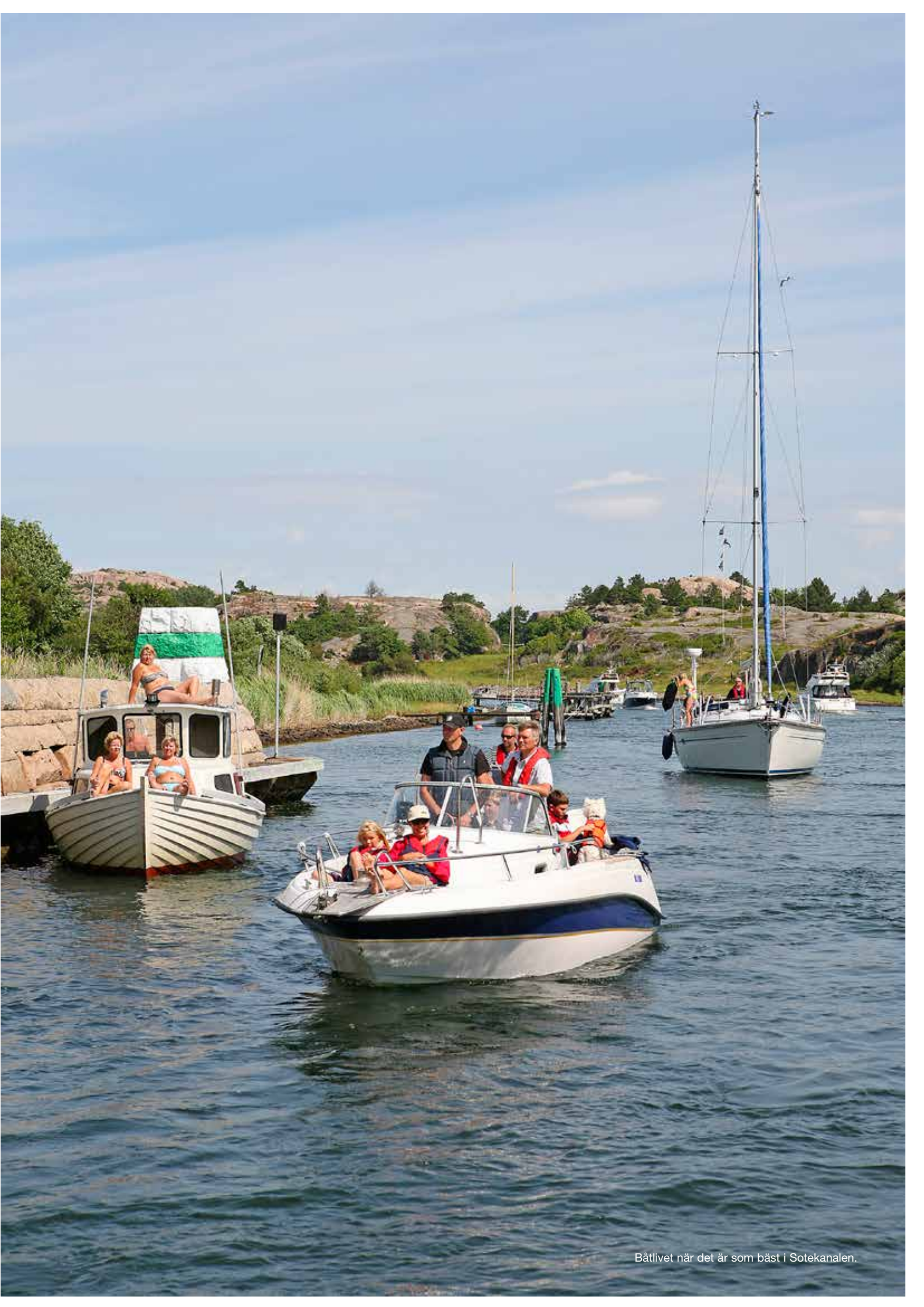
Båtlivet när det är som bäst i Sotekanalen.