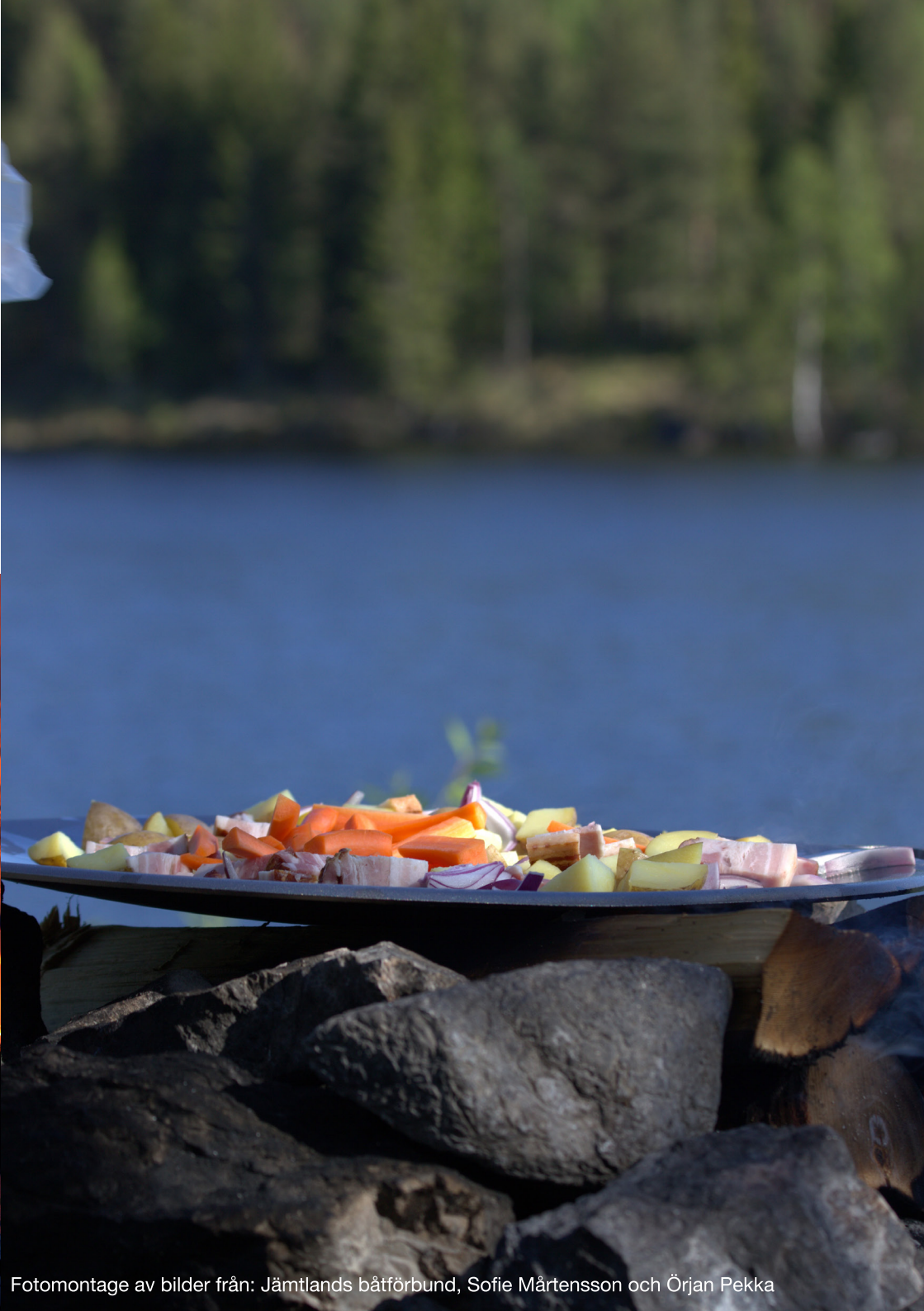
Fotomontage av bilder från: Jämtlands båtförbund, Sofie Mårtensson och Örjan Pekka