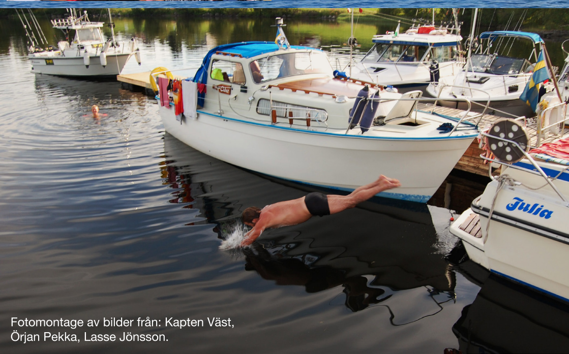
Fotomontage av bilder från: Kapten Väst, Örjan Pekka, Lasse Jönsson.